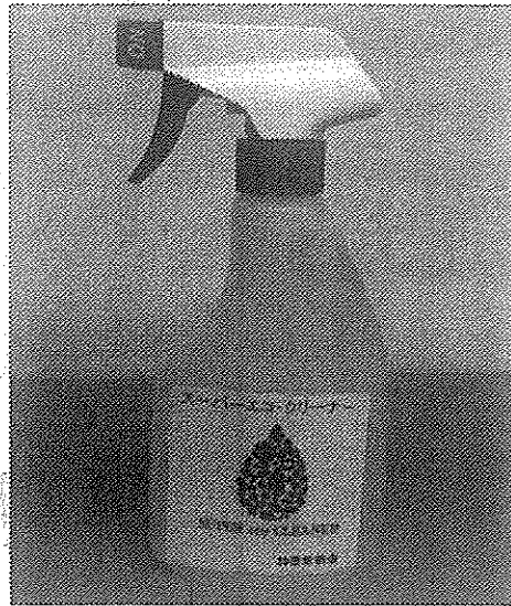
▶20倍希釈済のスーパーエコ・クリーナースプレー ボトル用

多くの洗剤が大理石には使用できなかつたり、光沢を出すために別途光沢剤が、ティーエスピー(広島県広島市)の「スーパーエコ・クリーナー」は、1本で「洗剤。溶剤のように汚れを溶かして落とすのではなく、汚れを分解し落とすのが特徴。このため、アルカリ電解水とは異なり、ほとんどの素材に使用できるのだ。また泡立ちがほとんど